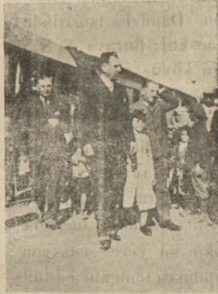
Meclis Reisi Kâzım Paşa Hz.